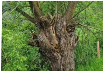
Silber-Weide in der Weidenallee Hetlingen