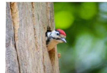
Buntspecht im Klövensteen

Sonntag, 05.07.2026, 8-11 Uhr Vogelführung im Klövensteen Treffpunkt: Waldschule im Wildgehege, Sandmoorweg 150, 22559 Hamburg Info und Anmeldung: waldschule@altona.hamburg.de